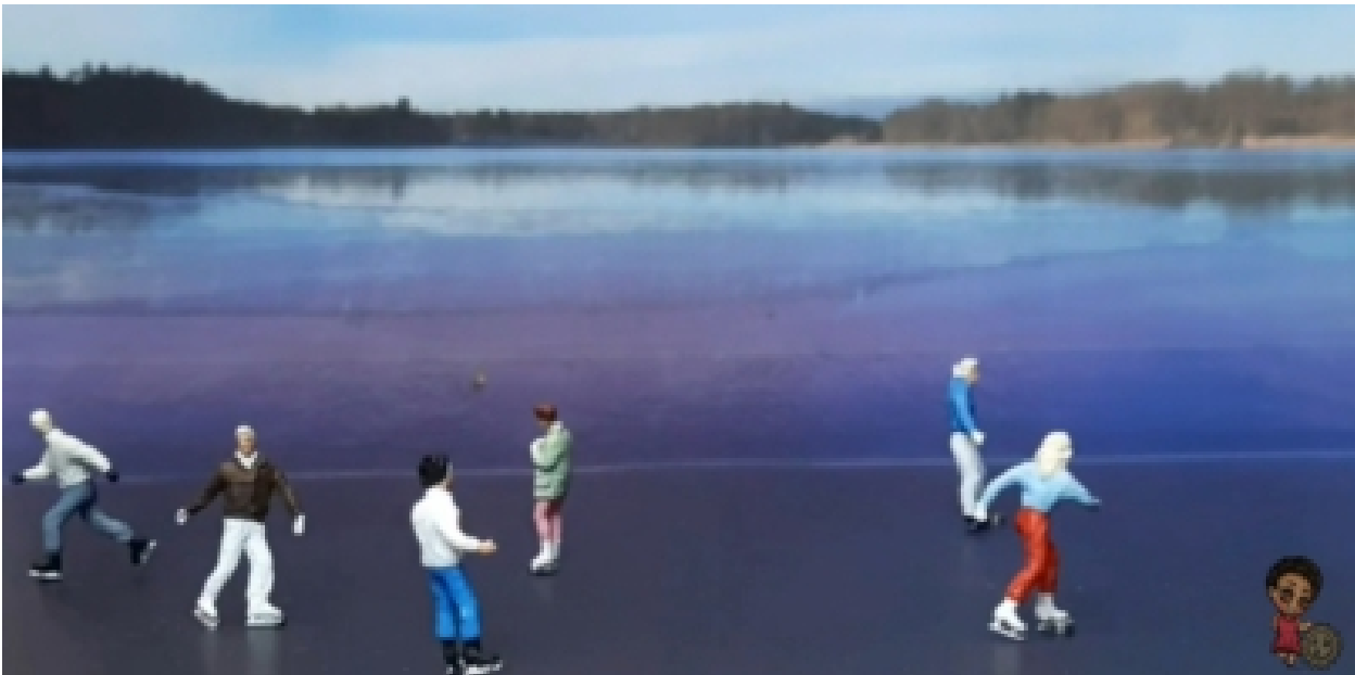
Die Preiserleins gleiten elegant übers Eis